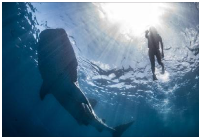
Det er en fascinerende og nærmest surrealistisk oplevelse at svømme helt tæt på verdens største fisk.

De dygtige og habile svømmere får tre ture på siden af en hvalhaj, mens de knap så habile må stille sig tilfreds med en enkelt kort tur eller med blot at se dem, når de svømmer forbi. De der ikke lykkedes med en rigtig svømmetur, er