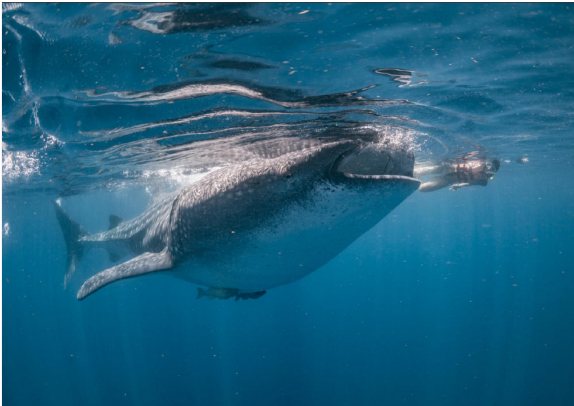
Der bliver suget enorme mængder vand ind, når den blide kæmpe åbner munden i jagt på føde.

dog ved godt mod alligevel, for vi har omkring 15 hvalhajer svømmende i overfladen omkring båden i de par timer, vi er ude, så helt snydt føler de sig ikke. Udsigten er eminent denne formiddag.