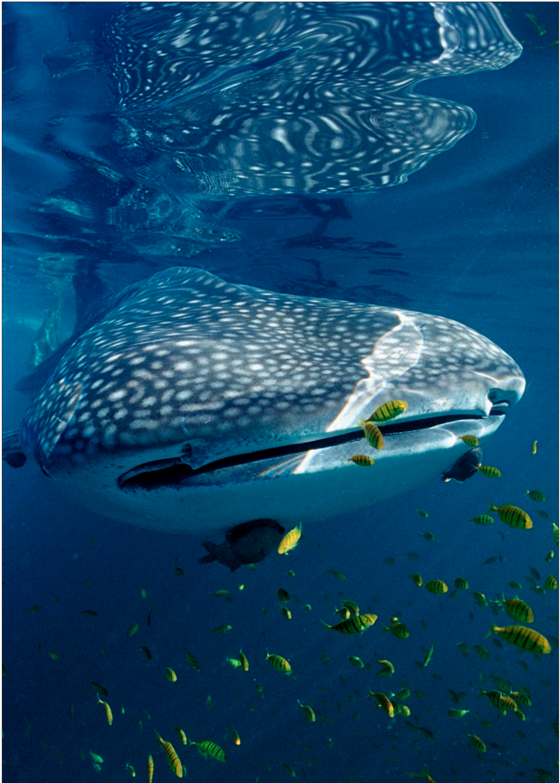
Selvom verdens største fisk er en haj, kan de små fisk roligt svømme videre. Hvalhajen lever nemlig af plankton.