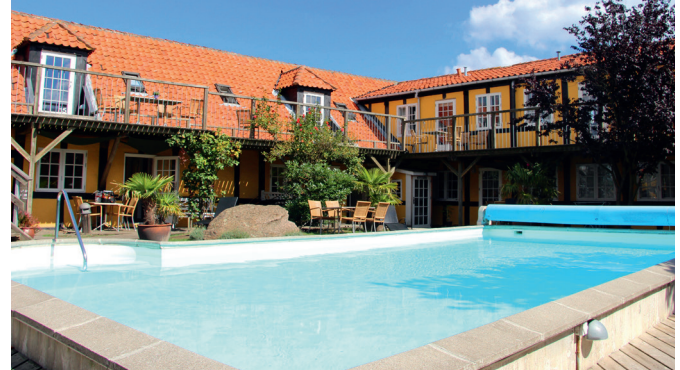
Østersøens ferielejligheder i Svaneke.

Ved Svaneke havn ligger ØSTERSØEN FERIELEJLIGHEDER . Ud over en sublim placering ud til havnen er en af finesserne ved komplekset den store opvarmede pool i gårdhaven. Her kan store såvel som små sole og bade og føle sig hensat til Sydens sol for en stund. TeamBornholm.dk Er du til det hyggelige campingliv, så er Hullehavn Camping en fantastisk campingplads lige ved Hullehavn, som er en lille sandstrand med en dejlig afslappet atmosfære. Her kan der soppes, bades, springes fra vippe, klatres i klipper eller bare slappes helt af ved strandbaren Syd-Øst for Paradis. Campingpladsen er kun 10 minutters gang fra Svaneke centrum. Hullehavn.dk