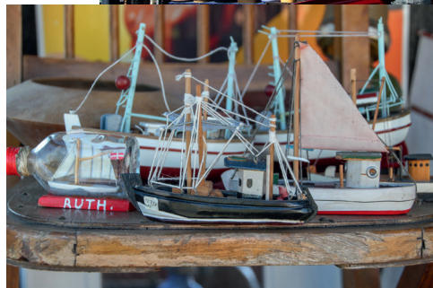
Bornholm er kendt for sine loppemarkeder – her Snogebæk.