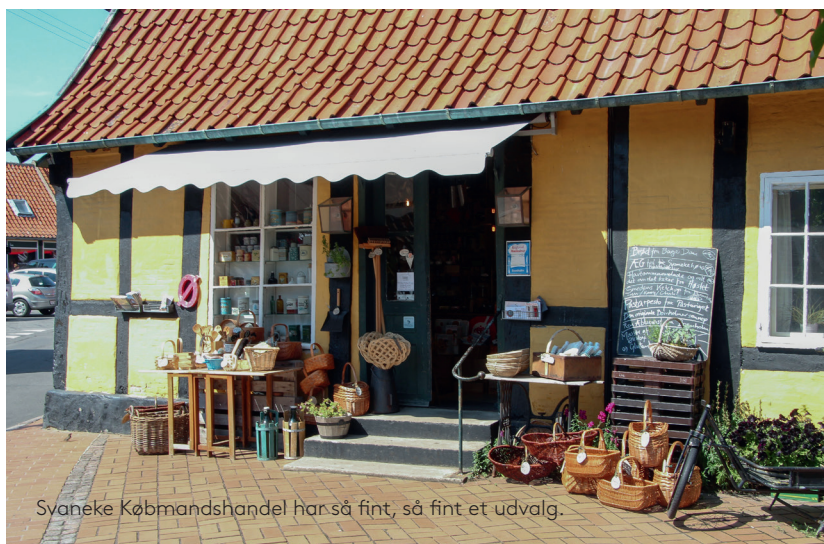
Svaneke Købmandshandel har så fint, så fint et udvalg.