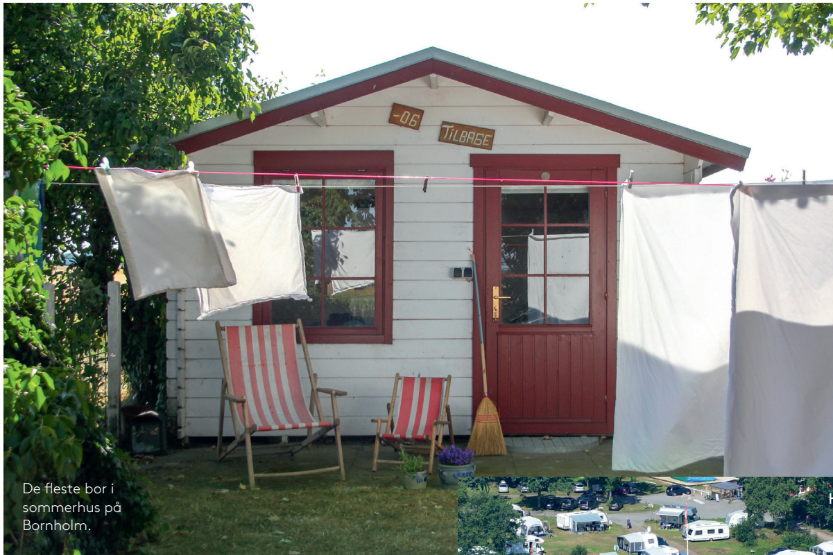
De fleste bor i sommerhus på Bornholm.