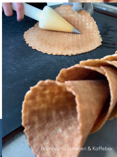
Bornholms Ismejeri & Kaffebar.

Den gamle Årsdale Mølle, der ligger på en bakketop over byen kan dateres tilbage til 1877 og har malet mel helt frem til 2003. Her males ikke mel længere, men møllen fungerer stadig, og som den eneste mølle i Danmark kan man komme ind i den, mens den arbejder. I tilknytning til møllen ligger Granitladen, hvor der sælges brugskunst af bornholmsk granit og natursten. Årsdale Silderøgeri, Gaden 2.