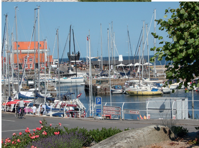
Svaneke er kåret som landets smukkeste købstad.