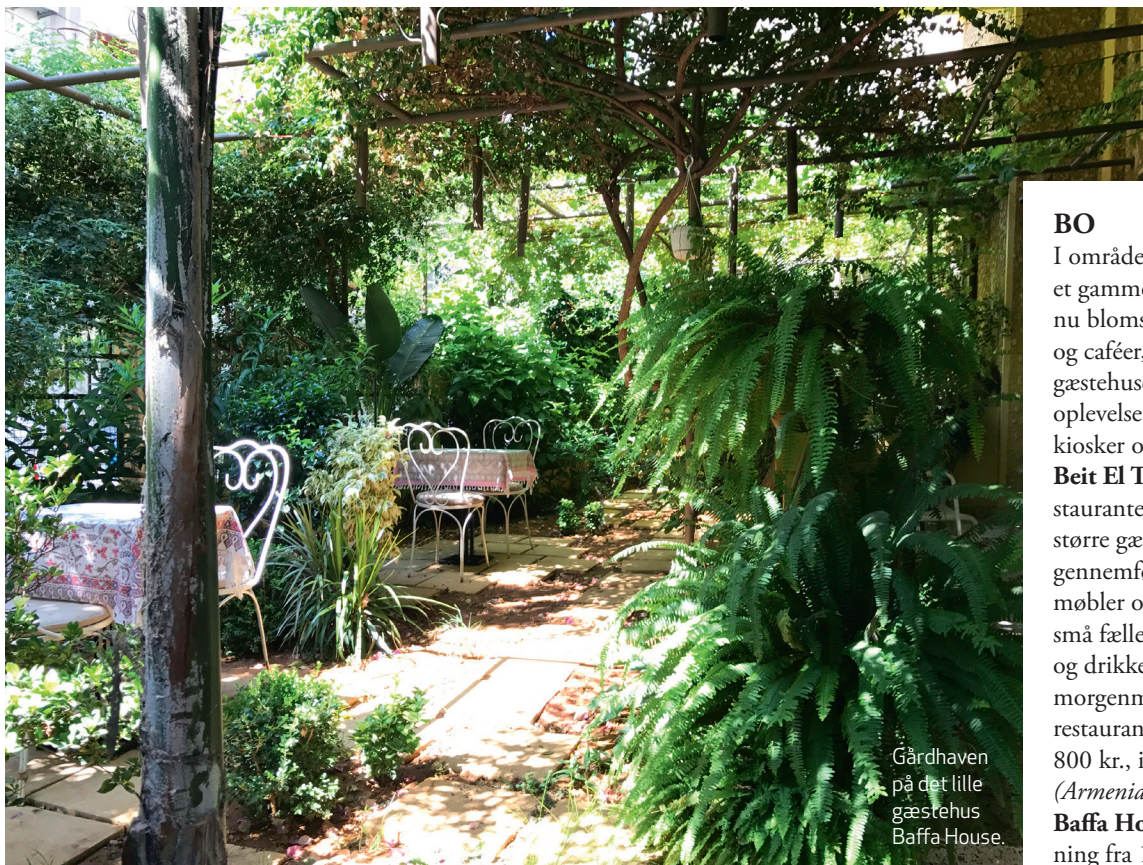
Gårdhaven på det lille gæstehus Baffa House.