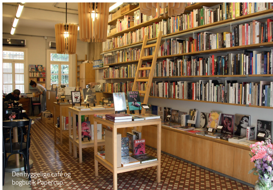
Den hyggelige café og bogbutik Papercup.

Zawal er en lille brugskunstbutik med keramik, tæpper, puder, viskestykker og plakater. Det meste er lokalt, men der sniger sig også lidt varer ind fra nabolandet Syrien ( Armenia St., Mar Mikhael ).