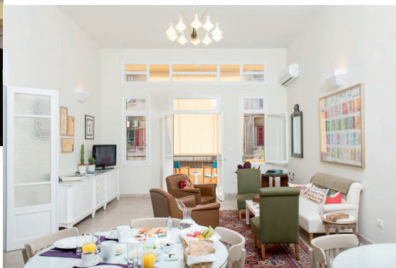
Morgenmadsserveringen foregår i den fælles opholdsstue hos Baff House.

Hvis du foretrækker lejlighed, er området Gemmayzeh ideelt. Det grænser op til Mar Mikhael og hovedgaden Gourand er et mekka med caféer og barer, der rigtig vågner op i de sene aftentimer. Tjek Airbnb, som har mange fine lejligheder i området.