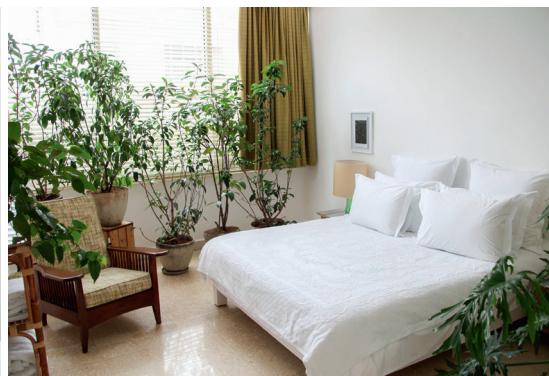
De 70'er-inspirerede værelser hos Beit El Tawlet.