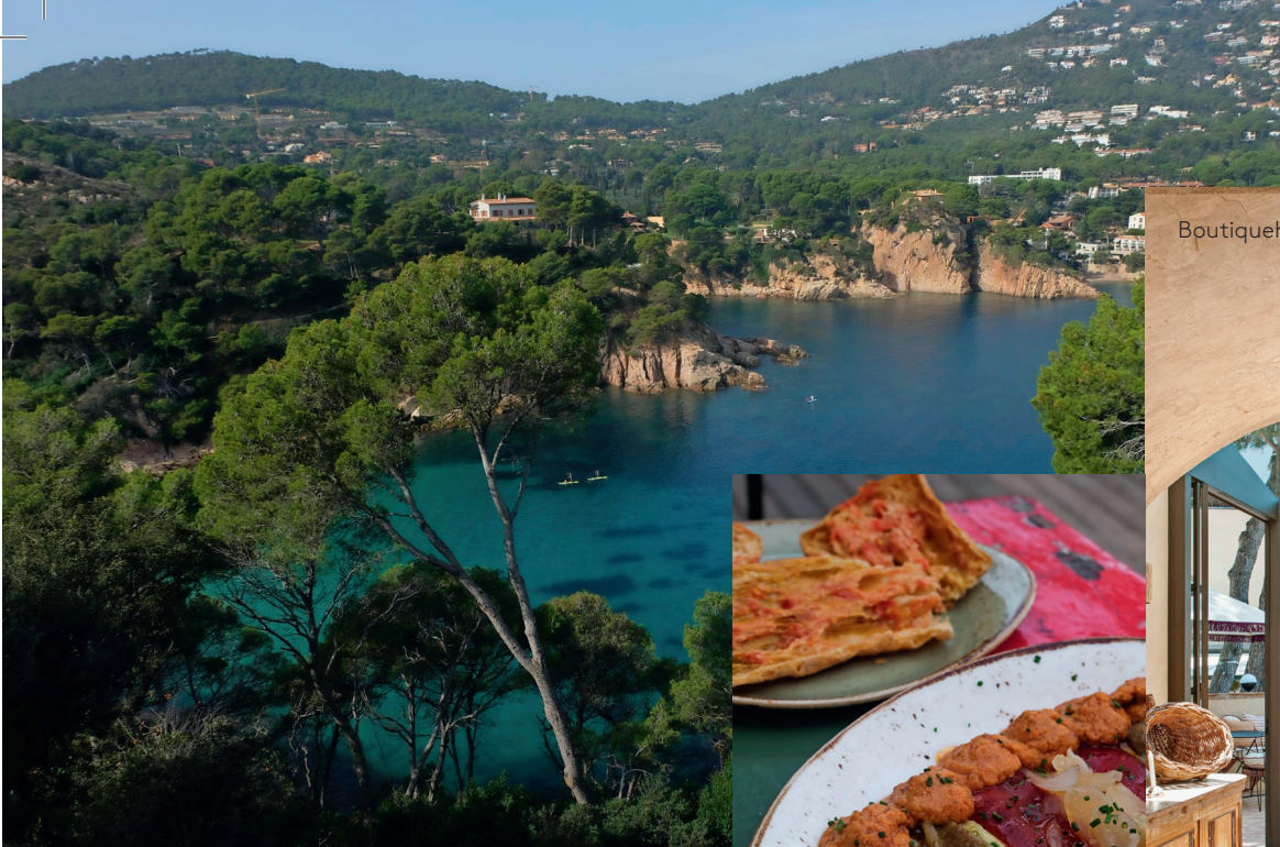
Boutiquehotellet La Bionda.