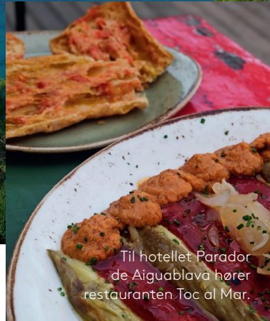
Til hotellet Parador de Aiguablava hører restauranten Toc al Mar.